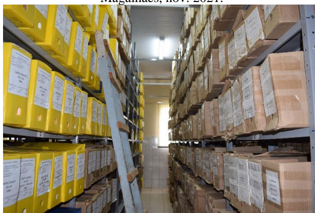
Imagem 03: a segunda sala do arquivo com os corredores e caixas de plástico e de papelão. Fotografia Cristiane Magalhães, nov. 2021.