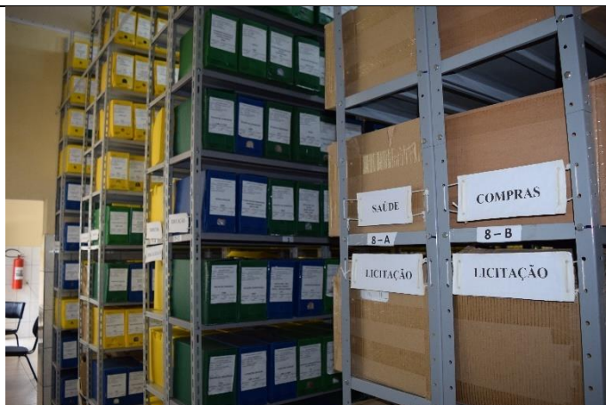
Imagem 04: mais imagens das prateleiras com as caixas na segunda sala do arquivo. Fotografia Cristiane Magalhães, nov. 2021.