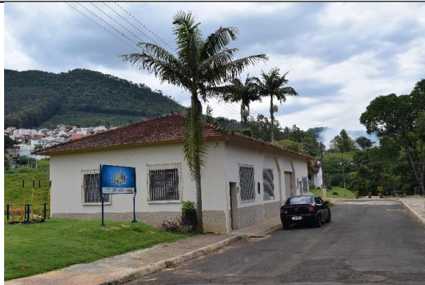
Imagem 01: Edificação onde está abrigado o Arquivo Público Municipal de Andradás. Fotografia Cristiane Magalhães, nov. 2021.