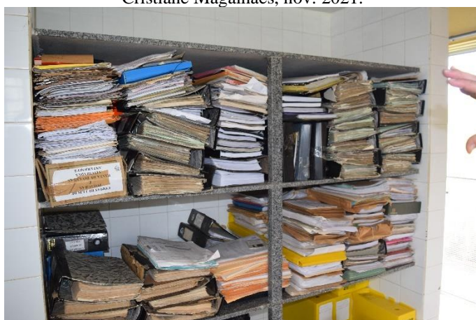
Imagem 05: uma terceira sala do arquivo possui estantes com livros e pastas mais antigos. nov. 2021.