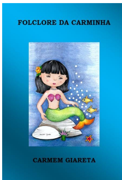
Imagem 05: Livro da moradora e entrevistada Carmem Giareta Área 01 e 02.