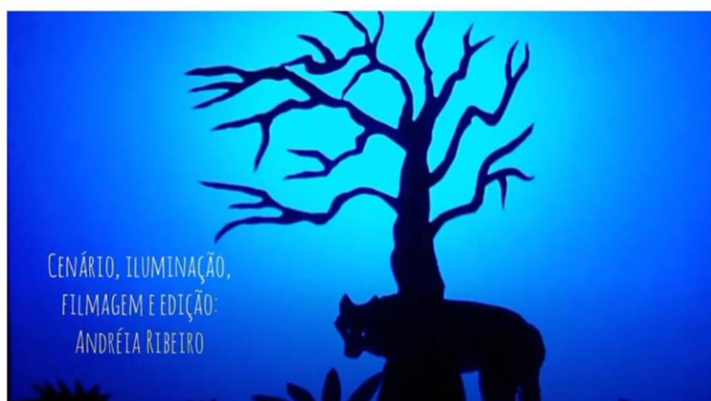
Imagem 04: Produção do teatro de sombra em vídeo sobre a Lenda do Adrianinho Lobo. Área 01 e 02.