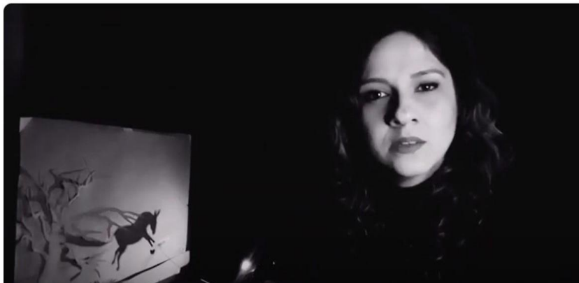
Imagem 03: Produção do teatro de sombra em vídeo sobre a Lenda do Adrianinho Lobo. Área 01 e 02.