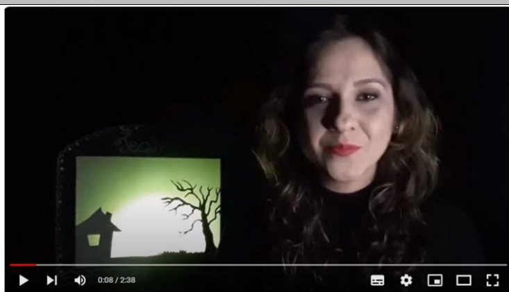
0 Homem Lobo

Imagem 01: Produção do teatro de sombra em vídeo sobre a Lenda do Adrianinho Lobo. Área 01 e 02.