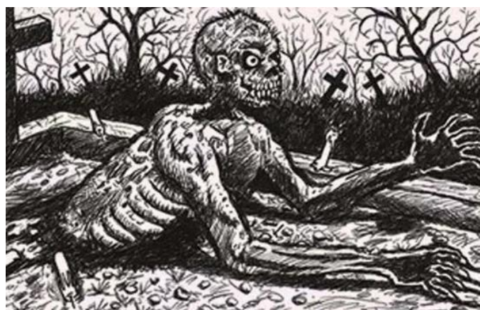
Imagem 03: Ilustração da Lenda do Corpo Seco. Fonte: https://www.meionews.com/ , Área 01 e 02.