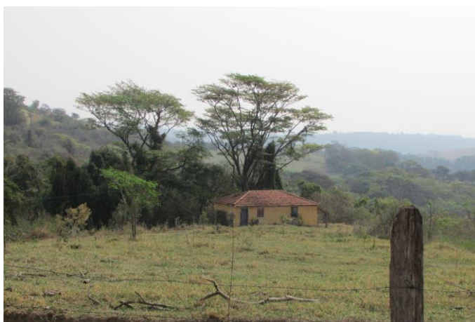
Imagem 02: Local onde, supostamente, o Corpo Seco é visto. Fotografia de Jussara D. S. Dias, ago/2024. Área 01 e 02.