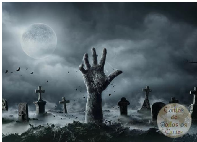
Imagem 04: Ilustração da Lenda do Corpo Seco. Área 01 e 02.