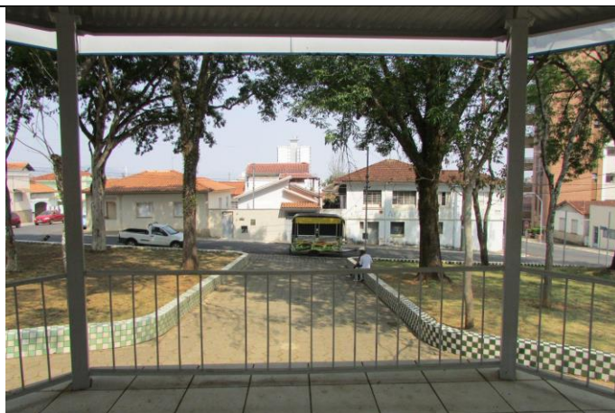
Imagem 09: Praça Doutor Edmundo Venturelli. Fotografia de Jussara D. S. Dias, ago/2024. Área 01.