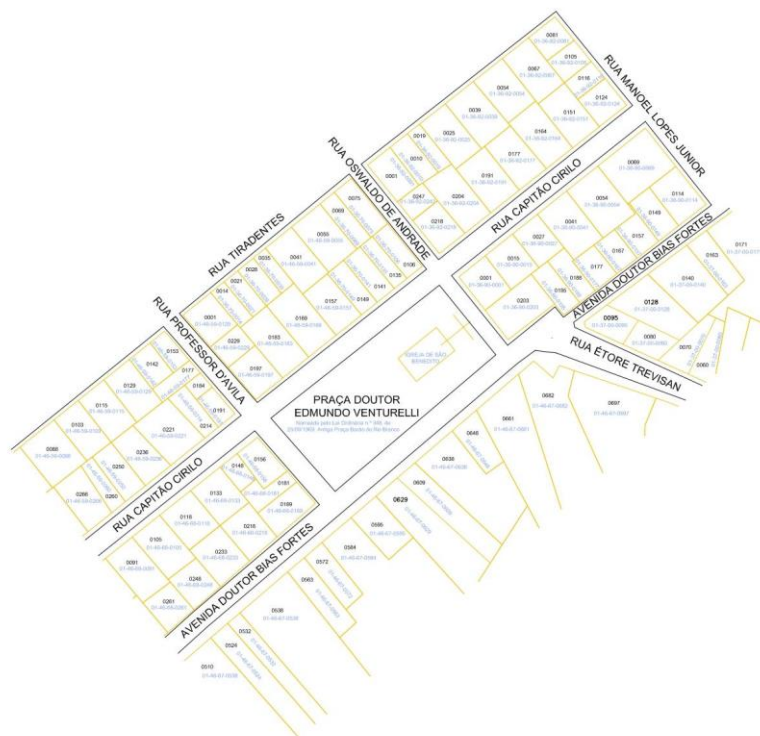
Planta da Praça Doutor Edmundo Venturrelli