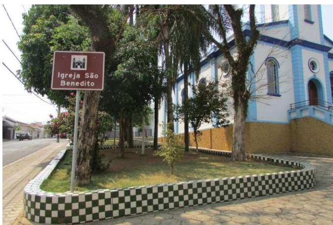
Imagem 08: Praça Doutor Edmundo Venturelli. Fotografia de Jussara D. S. Dias, ago/2024. Área 01.