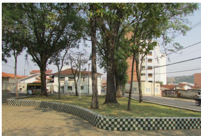
Imagem 11: Praça Doutor Edmundo Venturelli. Fotografia de Jussara D. S. Dias, ago/2024. Área 01.