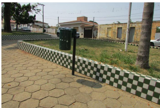
Imagem 10: Praça Doutor Edmundo Venturelli. Fotografia de Jussara D. S. Dias, ago/2024. Área 01.