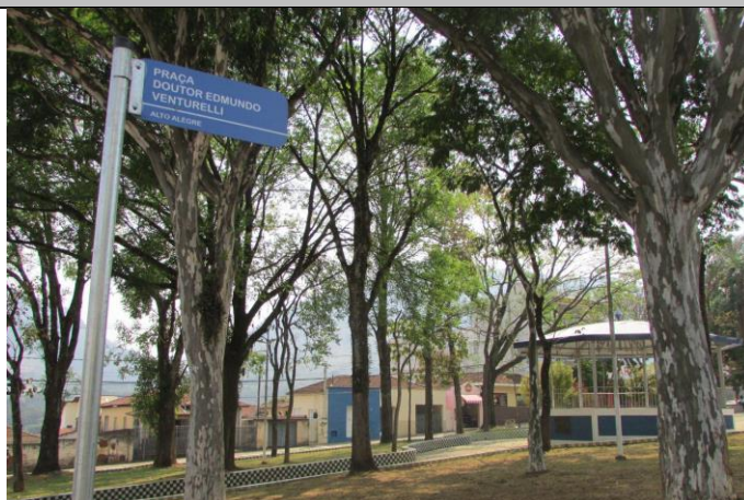
Imagem 01: Praça Doutor Edmundo Venturelli. Fotografia de Jussara D. S. Dias, ago/2024. Área 01.