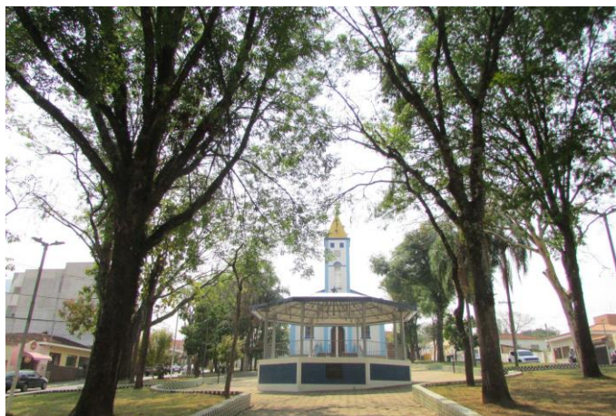
Imagem 02: Praça Doutor Edmundo Venturelli. Fotografia de Jussara D. S. Dias, ago/2024. Área 01.