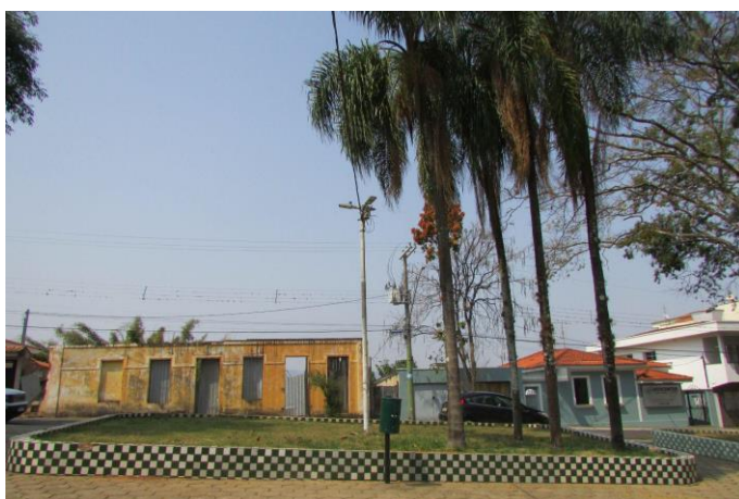
Imagem 07: Edificações do entorno da Praça Doutor Edmundo Venturelli. Fotografia de Jussara D. S. Dias, ago/2024. Área 01.