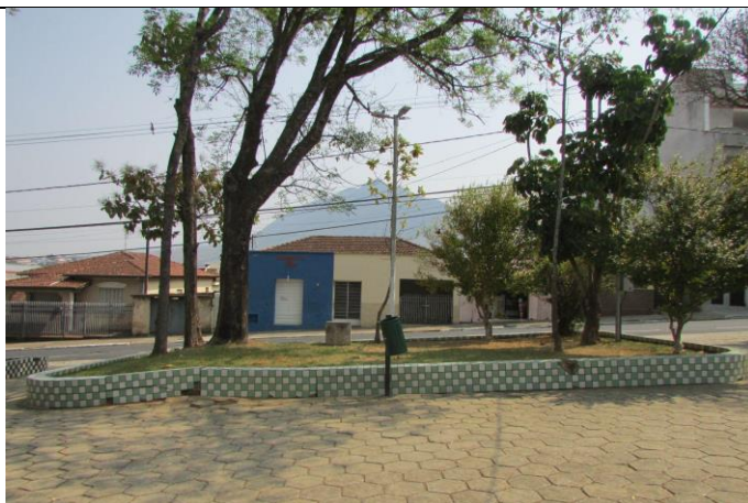
Imagem 06: Praça Doutor Edmundo Venturelli ao fundo a Serra do Caracol Fotografia de Jussara D. S. Dias, ago/2024. Área 01.