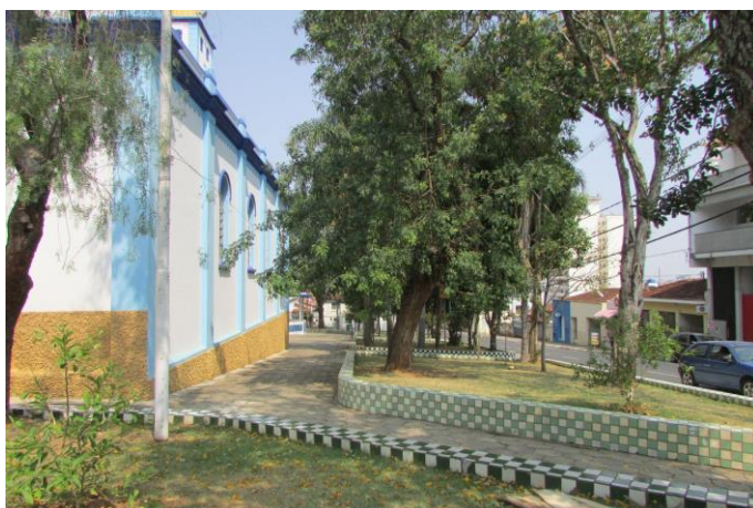
Imagem 05: Lateral direita da Praça Doutor Edmundo Venturelli. Fotografia de Jussara D. S. Dias, ago/2024. Área 01.