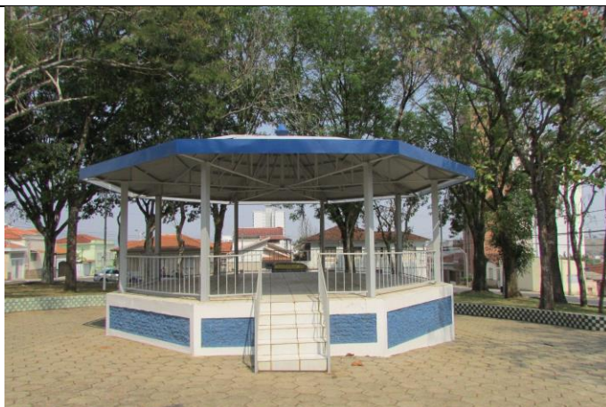
Imagem 03: Coreto ao centro Praça Doutor Edmundo Venturelli. Fotografia de Jussara D. S. Dias, ago/2024. Área 01.