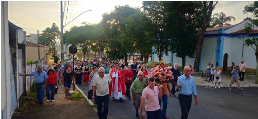
Imagem 04: Procissão de Santa Luzia de 2024. Fotografia do acervo da Paróquia de São Sebastião, dez/2024. Área 2 – Seção B.