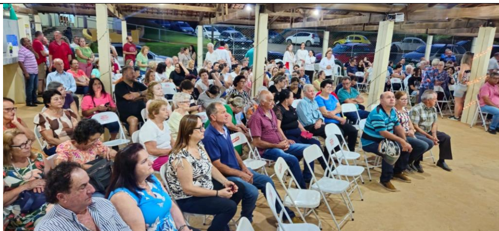
Imagem 07: Procissão de Santa Luzia de 2024. Fotografia do acervo da Paróquia de São Sebastião, dez/2024. Área 2 – Seção B.