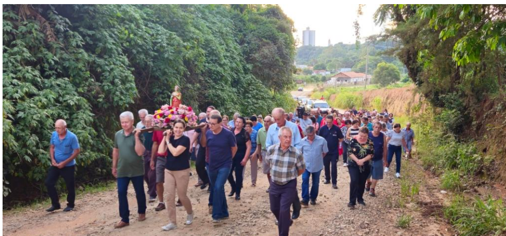
Imagem 05: Procissão de Santa Luzia de 2024. Fotografia do acervo da Paróquia de São Sebastião, dez/2024. Área 2 – Seção B.