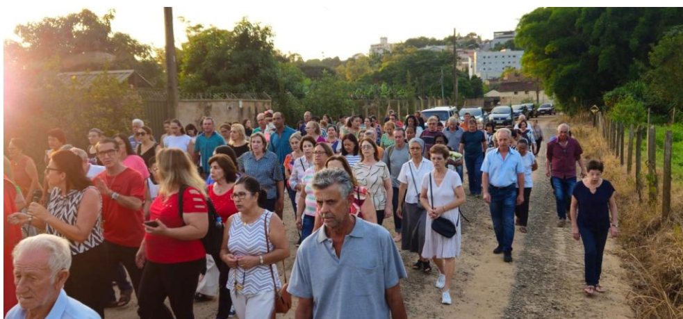
Imagem 06: Procissão de Santa Luzia de 2024. Fotografia do acervo da Paróquia de São Sebastião, dez/2024. Área 2 – Seção B.