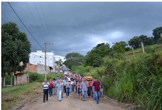
Imagem 03: Procissão de Santa Luzia de 2019. Fotografia do acervo da Paróquia de São Sebastião, dez/2019. Área 2 – Seção B.