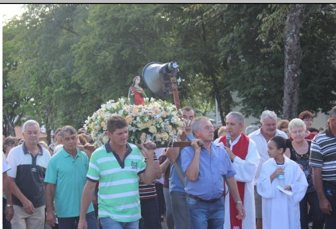
Imagem 02: Procissão de Santa Luzia de 2018. Fotografia do acervo da Paróquia de São Sebastião, dez/2018. Área 2 – Seção B.